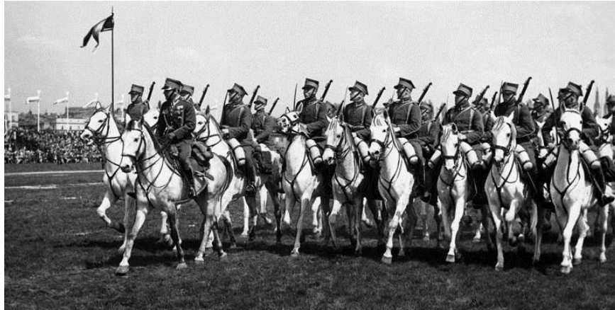
Kawaleria - ukochane wojsko Polaków. Na zdjęciu: UŁANI